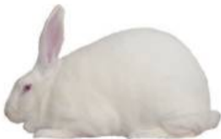
خرگوش نیوزلندی سفید