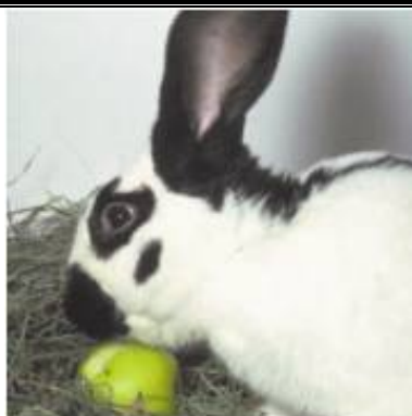
خرگوش شطرنجی غول پیکر